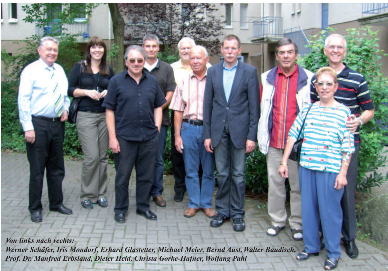
Von links nach rechts:

Herausgeber: Gartenstadt-Genossenschaft Mannheim eG K 2,12-13 68159 Mannheim Internet: http://www.gartenstadt-genossenschaft.de e-mail: info@gartenstadt-genossenschaft.de Tel.: 06 21 / 1 80 05-0 Fax: 06 21 / 1 80 05-48 V.i.S.d.P.: Wolfgang Pahl