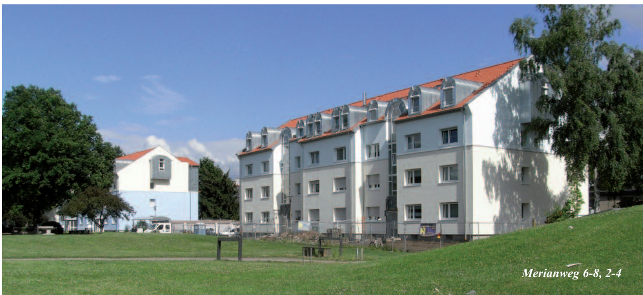
Merianweg 6-8, 2-4

Vielleicht haben Sie ja die kleine Gesellschaft am 20. Juni 2009 in Ihrem Wohngebiet zufällig gesehen. Der Aufsichtsrat der Gartenstadt-Genossenschaft hatte sich gemeinsam mit dem Vorstand nämlich an diesem Samstag ein Bild von aktuellen Sanierungsprojekten vor Ort gemacht. So war das Gremium in der Speyerer Straße, im Steinsburgweg, in der Kolmarer Straße, in der Neckarhauser Straße, im Soldatenweg/Siebseeweg, Am Grünen Hag, im Sylter Weg und in der Holzbauerstraße.