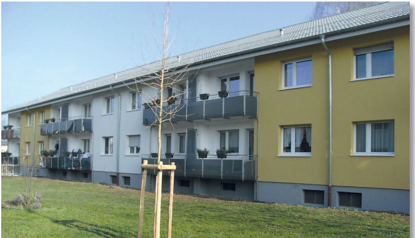
In Käfertal Nord setzte die Genossenschaft die Modernisierungsbemühungen mit dem Anwesen Am Kuhbuckel 31 bis 35 aus dem Baujahr 1966 mit 12 Wohnungen fort. Das Gebäude erhielt ein Wärmedämmverbundsystem, ein gedämmtes Dach, neue Balkongeländer und -böden und neue Vordächer.